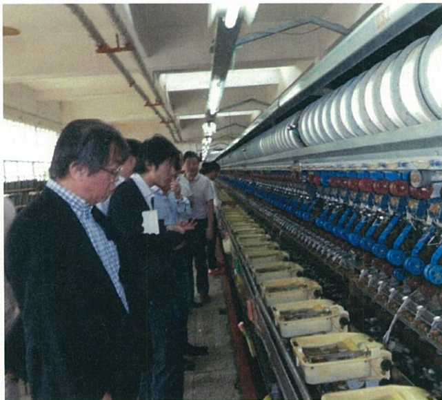
(云南新千佛茧丝绸有限公司の製糸工場)