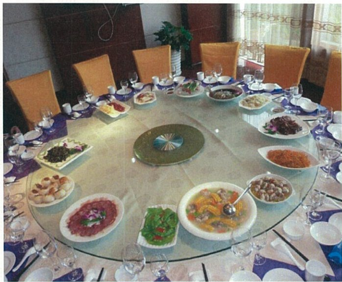
(陸良村の食堂での地元料理)